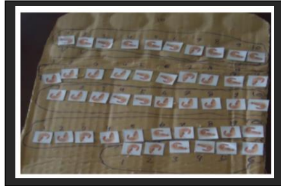
Gambar 1. Hasil Pengelompokan manipulative Kelompok 2 (V dan N)

susun dalam 4 ikatan puluhan dan 6 satuan, siswa melakukan perhitungan 10, 20, 30, 40 kemudian 1, 2, 3, 4, 5 dan 6 yang seharusnya 10, 20, 30, 40, 41, 42, 43, 44, 45 dan 46. (Perhatikan gambar 1)