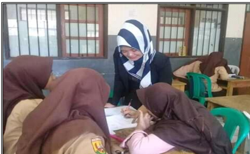
Gambar 1. Kegiatan Pembelajaran Kelas PBL.