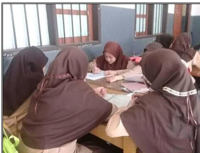
Gambar 2. Kegiatan Pembelajaran Kelas PPL.